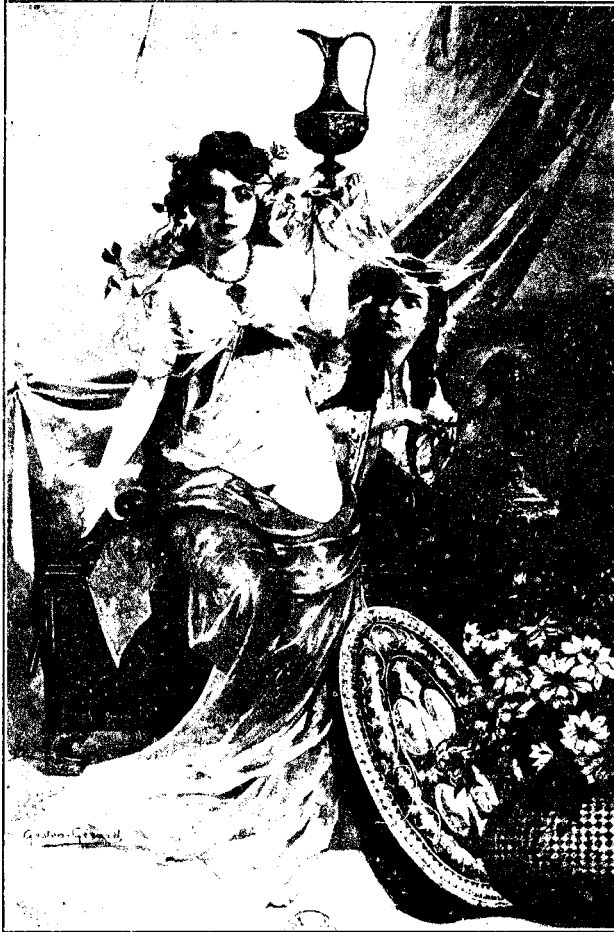
L'ORFÈVRE (aquarelle sur toile)