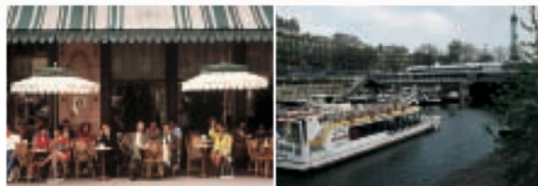
Gauche Café de la Paix Droite Visite des canaux