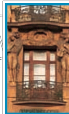
PAGES 142-157 Atlas des rues Plans 3-6