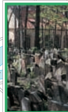
PAGES 80-93 Atlas des rues Plans 3-4