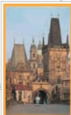
PAGES 122-141 Atlas des rues Plans 1-2