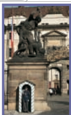
PAGES 94-121 Atlas des rues Plans 1-2