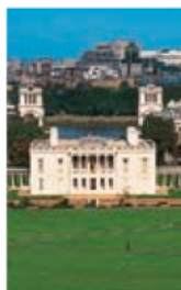
Queen's House, Greenwich

Ce guide divise Londres en 8 quartiers du centre, et ses environs en 3 parties : le Nord, l'Est et le Sud et l'Ouest. Le plan ci-dessous montre la situation et l'étendue de ces parties. Chaque quartier est identifiable par une couleur reprise tout au long du guide. Les principaux sites mentionnés dans cet ouvrage comportent une référence permettant de les repérer sur les 2 plans généraux situés sur les rabats au début et à la fin du guide.