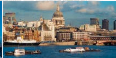
Gauche: Shepherd Market Centre gauche: Royal Opera House Centre droite: London Eye Droite: Vue de la City