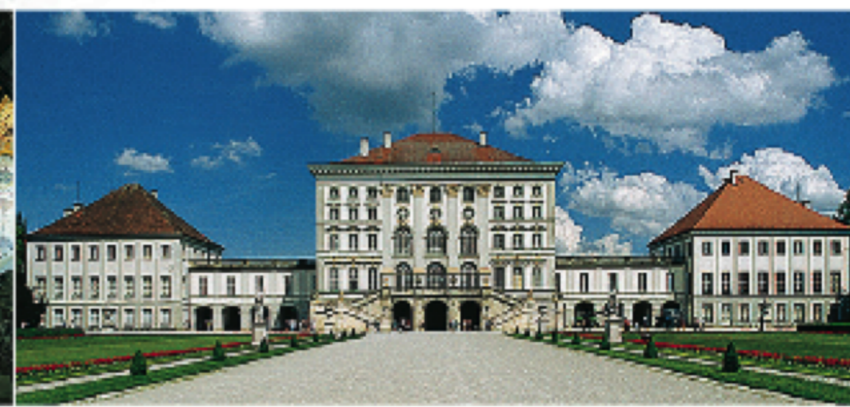
Gauche Hôtel de ville néogothique de Marienplatz Centre gauche Oktoberfest Centre droite Intérieur de la Residenz Droite Schloss Nymphenburg