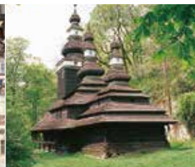
Gauche Façade du palais Golz-Kinsky Droite Église Saint-Michel, colline de Petřín