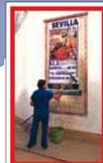
SÉVILLE pages 426-457