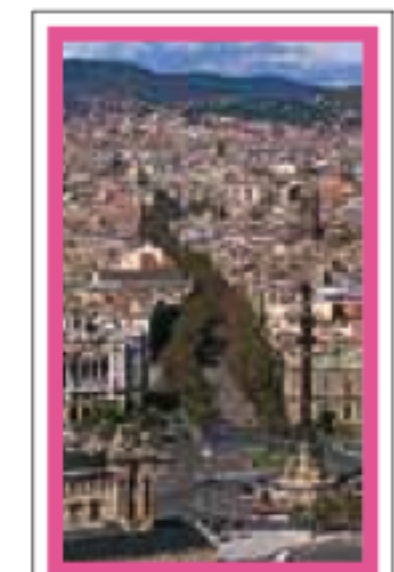
BARCELONE pages 136-195