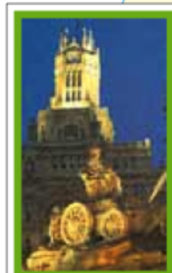
MADRID pages 264-333