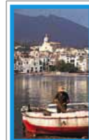
CATALOGNE pages 206-225