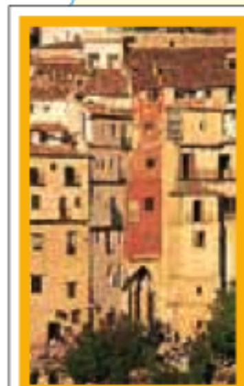
CASTILLE-LA MANCHE pages 378-399