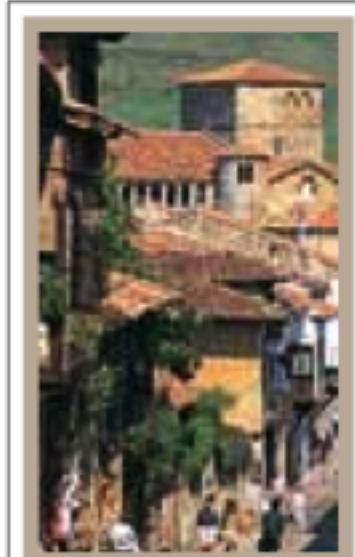
ASTURIES ET CANTABRIE pages 100-113