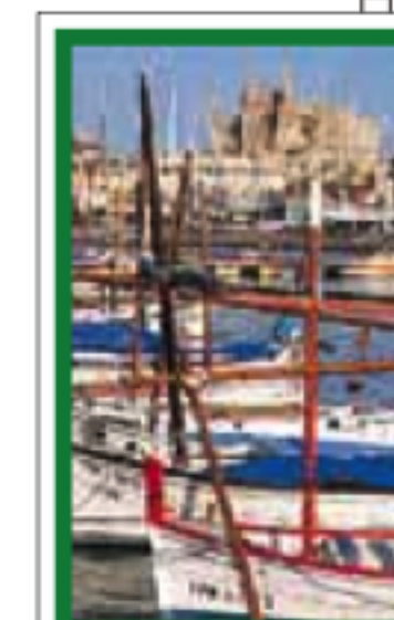
BALÉARES pages 506-527