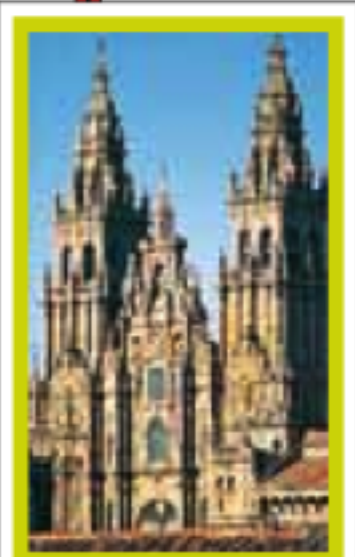
GALICE pages 84-99