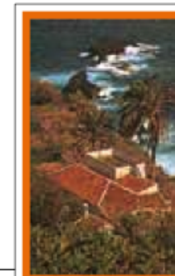
CANARIES pages 528-551