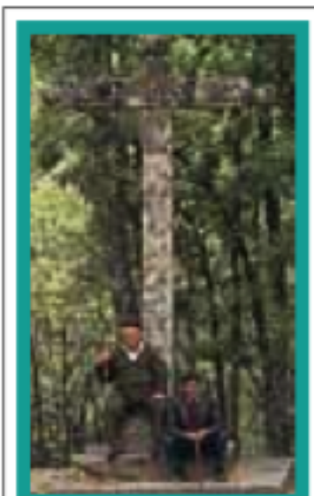
ESTRÉMADURE pages 400-413