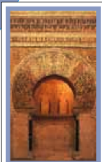
ANDALOUSIE pages 458-501