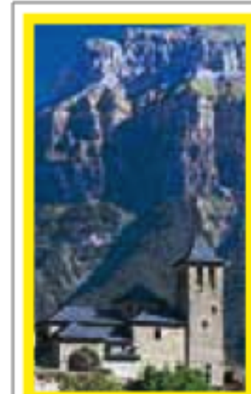
ARAGON pages 226-241