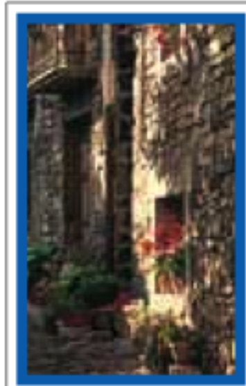
PAYS BASQUE, NAVARRE ET RIOJA pages 114-135