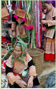
Le Vietnam du Nord Pages 182-205