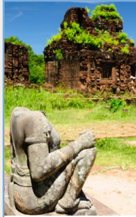
Le Vietnam central Pages 124-155