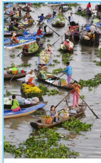
Le delta du Mékong et le Vietnam du Sud Pages 88-105