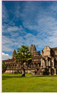
Excursion à Angkor Pages 206-229