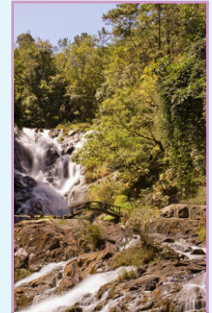
La côte et les hauts plateaux du Sud Pages 106-123