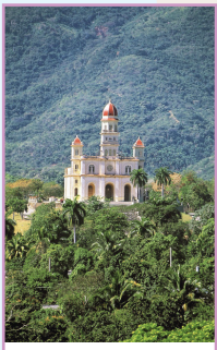
L'Orient pages 212-249