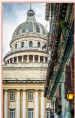
Centro Habana et le Prado pages 82-99