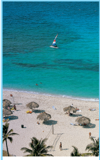
De Varadero à Santa Clara pages 158-181