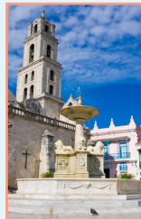
La Habana Vieja pages 64-81