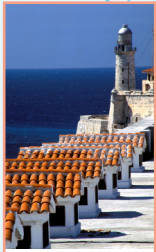
Les environs de La Havane pages 110-121