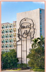
Vedado et Plaza pages 100-109