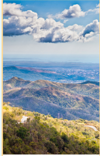
De Trinidad à Camagüey pages 182-211