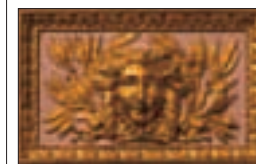
Détail du décor intérieur du Grand-Théâtre de Bordeaux