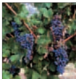
Raisins mûrs dans un vignoble d'Aquitaine