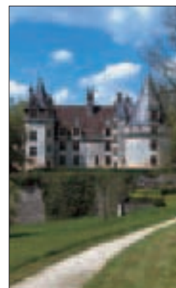
Le château de Puyguilhem, en Dordogne