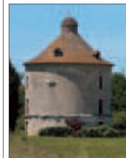
Pigeonnier traditionnel du Lot-et-Garonne