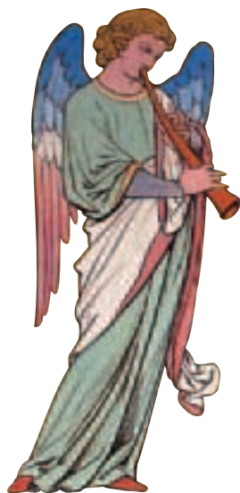
Détail de la chambre rose, château de Roquetaillade