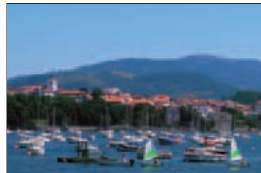
Le port d'Hendaye, au Pays basque