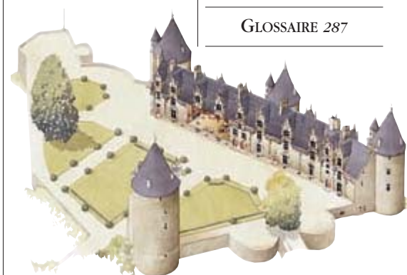
Le château de Josselin (p. 192-193)