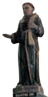
Santig Du, cathédrale Saint-Corentin à Quimper