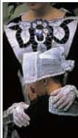
Détail de costume, pardon de Saint-Anne-d'Auray