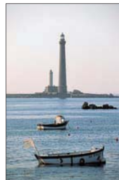
Le phare de l'île Vierge dans les Côtes-d'Armor