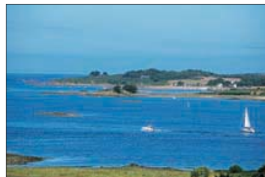
L'estuaire du Jaudy à Plougrescant, Côtes-d'Armor