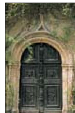
Le château de Traonjoly, Finistère Nord