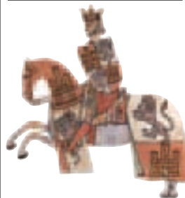
Alphonse X le Sage