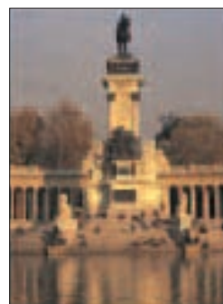
Statue d'Alphonse XII, Madrid