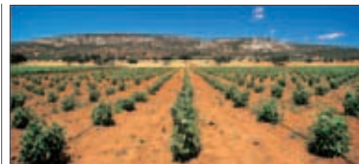
D'immenses vignobles s'étendent dans la Manche