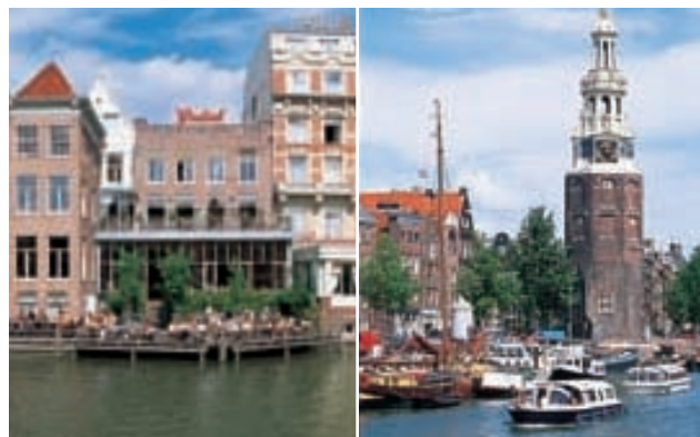
Gauche Café de Jaren Droite Montelbaanstoren, Oude Schans