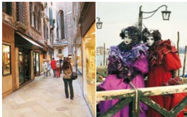
Gauche Boutiques des Mercerie Droite Carnaval de Venise