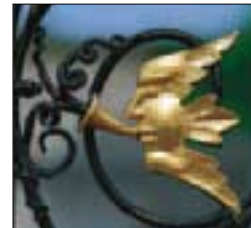
Détail de la Chorus Gate de Powerscourt (p. 134-135)

ATLAS ET RÉPERTOIRE DES NOMS DE RUES 116