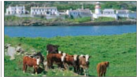
Vaches paissant à Spanish Point près de Mizen Head (p. 167)