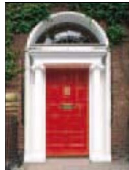
Porte georgienne au Fitzwilliam Square à Dublin (p. 68)