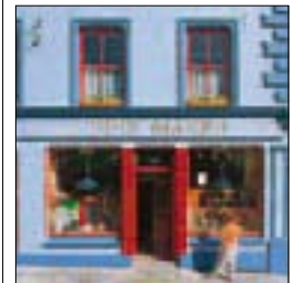
Façade d'un pub de Dingle (p. 157)

CARTE ROUTIÈRE Second rabat de couverture