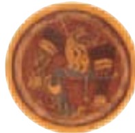
Symbole évangélique du Book of Kells (p. 62)