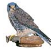
Faucon des Highlands

SÉJOURS À THÈME ET LOISIRS DE PLEIN AIR 198