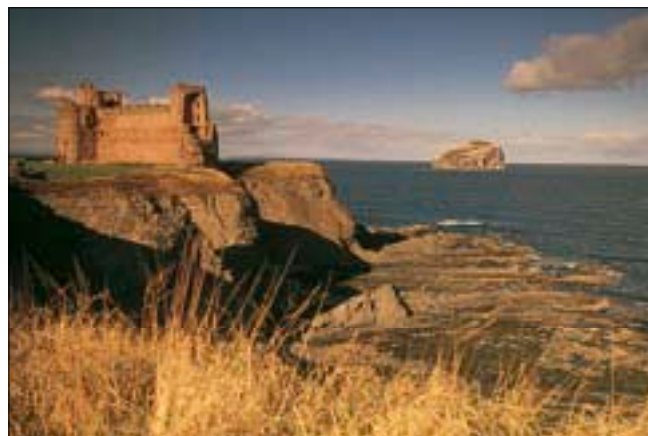
Les ruines spectaculaires de Tantallon Castle sur la côte sud-est

Aussi soigneusement qu'il ait été établi, ce guide n'est pas à l'abri des changements de dernière heure. Faites-nous part de vos remarques par e-mail à l'adresse suivante : voir@hachette-livre.fr .