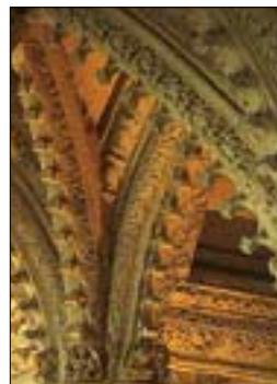
Détail des voûtes sculptées de Rosslyn Chapel dans les Pentlands