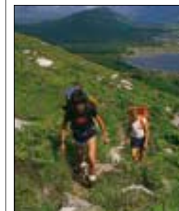
Balade dans le Glen Etive par une belle journée d'été

CARTE ROUTIÈRE DE L'ÉCOSSE Rabat arrière de couverture