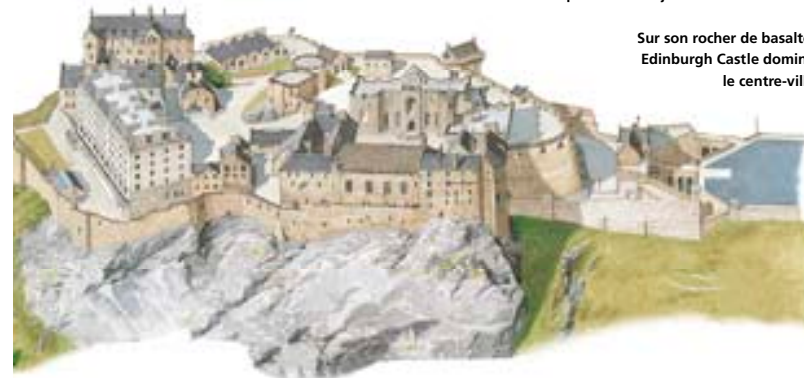
Sur son rocher de basalte, Edinburgh Castle domine le centre-ville