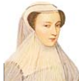
Marie Stuart (1542-1587), reine d'Écosse