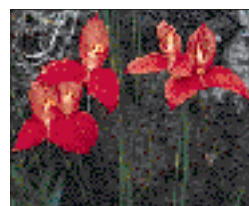
Disas rouges sur la Table Mountain