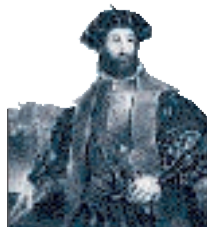
Vasco de Gama