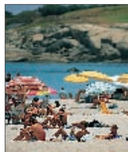
Camps Bay Beach, Cape Town