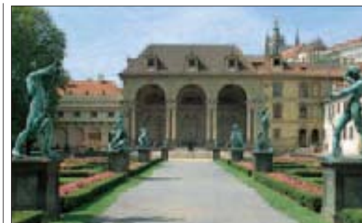
Le palais Wallenstein et son jardin, Petit Côté