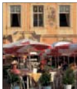
Une terrasse de café