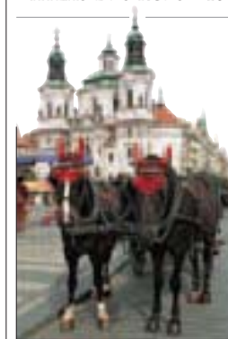
Calèche, place de la Vieille-Ville