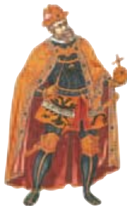
Rodolphe II (1576-1612)