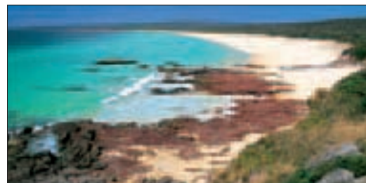
Sur la côte sud de la Nouvelle-Galles du Sud au Ben Boyd National Park

KINGS CROSS, DARLINGHURST ET PADDINGTON 116