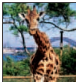
Girafe du Taronga Zoo de Sydney