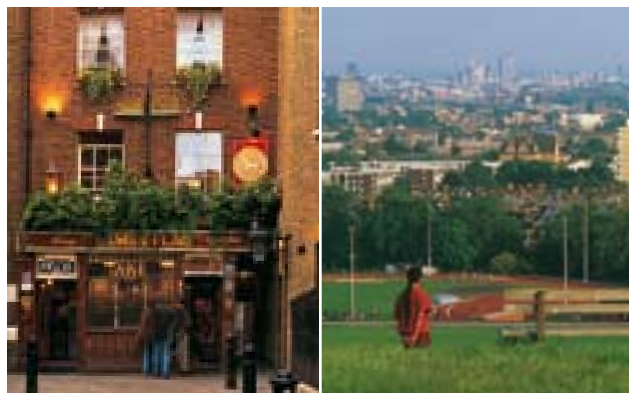
Gauche The Lamb and Flag, pub de Covent Garden Droite Vue panoramique du haut de Parliament Hill