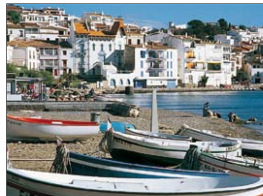
Port de Cadaqués sur la Costa Brava