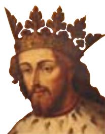
Jacques I er le Conquérant, souverain de la Catalogne de 1213 à 1276