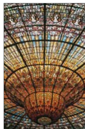
Verrière moderniste du Palau de la Música Catalana