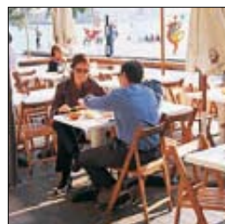
Dans un café du Port Vell rénové de Barcelone