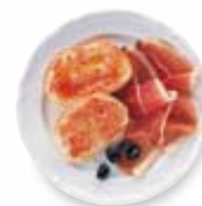
Pa amb tomàquet - tartines à la tomate, à l'ail et à l'huile d'olive