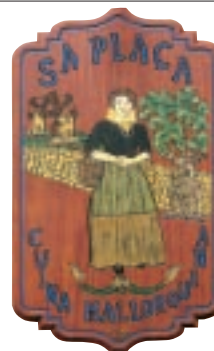
Enseigne de restaurant de spécialités majorquines