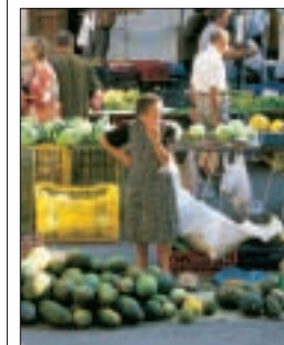
Marchande de melons sur le marché d'Inca