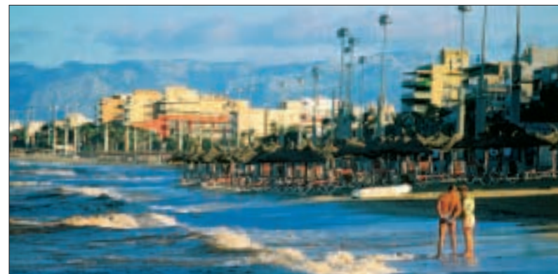
Lever de soleil sur la plage près du port de S'Arenal