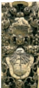
Cadran solaire baroque d'un palais de Palma