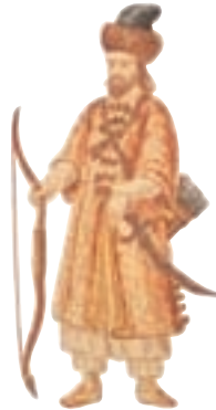
Le voyageur vénétien Marco Polo