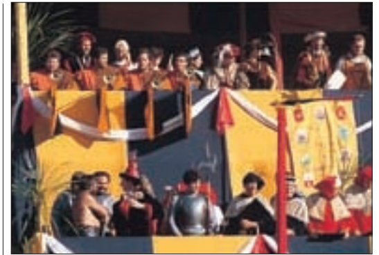
Le Palio dei Dieci Comuni, à Montagnana