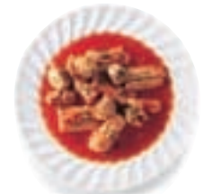
Anguilla in umido