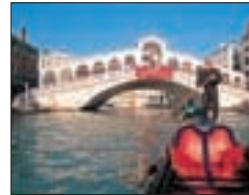
Le pont du Rialto, sur le Grand Canal