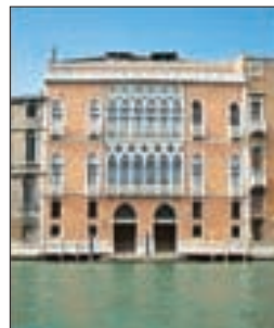
Le Palazzo Pisani Moretta, sur le Grand Canal