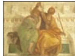
La Passion et la Vertu, par Véronèse, villa Barbaro à Maser