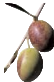
Olives de la vallée du Dadès