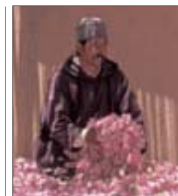
Pétales de roses destinés à la distillation