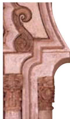
Détail de la mosquée de Tin Mal (p. 252)