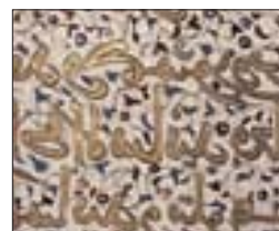
Enluminures d'un manuscrit