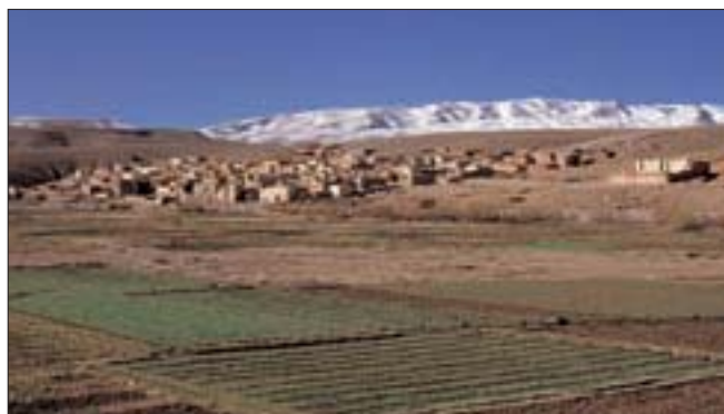
Vallée du Dadès (p. 272-273)

Aussi soigneusement qu'il ait été établi, ce guide n'est pas à l'abri des changements de dernière heure. Faites-nous part de vos remarques par e-mail à l'adresse suivante : voir@hachette-livre.fr