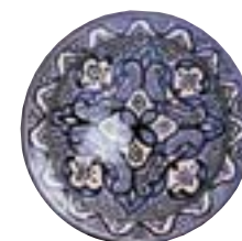
Plat de la région de Fès