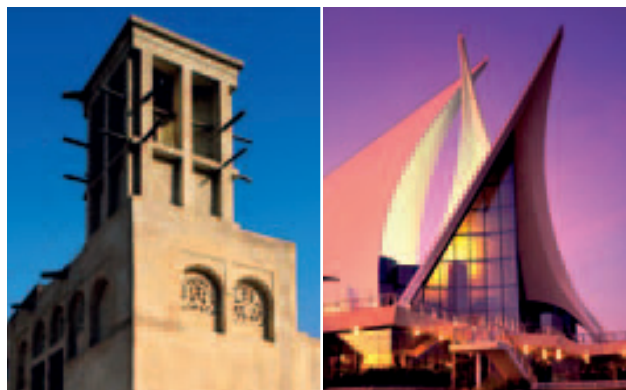
Gauche Tour à vent de Bastakiya Droite Dubai Creek Golf and Yacht Club