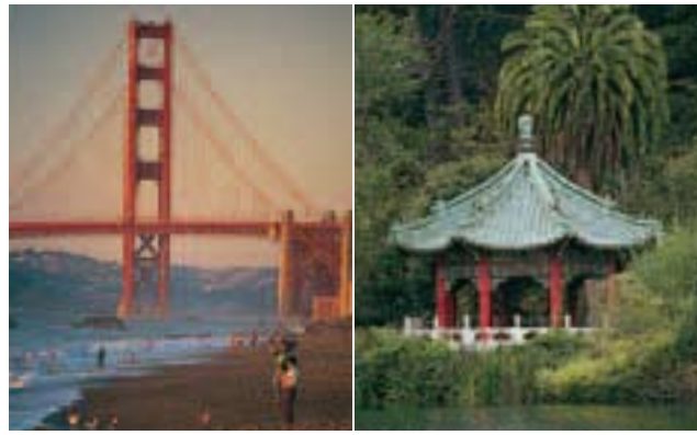
Gauche Golden Gate Bridge Droite Japanese Tea Garden du Golden Gate Park

➔ Abréviations : j.f. jour férié t.l.j. tous les jours AH Accès handicapés PAH Pas d'accès handicapés