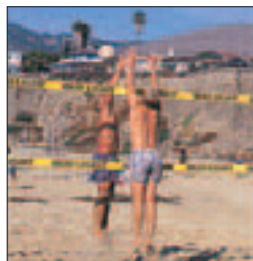
Volley-ball à Pismo Beach