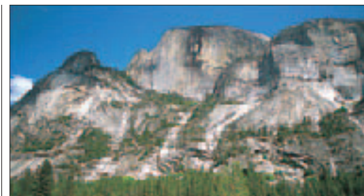
Le Half Dome du Yosemite National Park