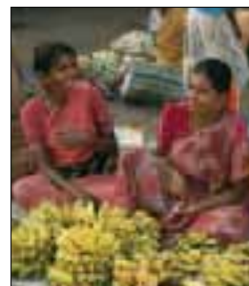
Vendeuses de fruits sur les trottoirs de Georgetown, Chennai