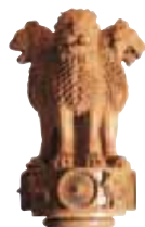
Sarnath, la capitale d'Ashoka

DÉPÔT LÉGAL : janvier 2010 ISBN 978-2-01-244375-4 ISSN 1246-8134 Collection 32 - Édition 01 N° DE CODIFICATION : 24-4375-2