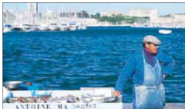
Pêcheur marseillais sur le Vieux-Port