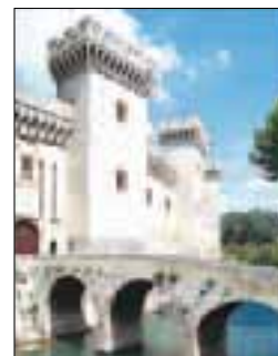
Le château de Tarascon

LA CÔTE D'AZUR ET LES ALPES-MARITIMES 60