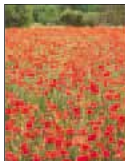
Champs en fleurs près de Sisteron