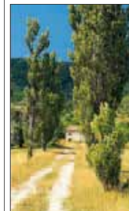
Exemple de paysages typiques entre Castellane et Grasse