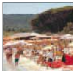
La plage de Pampelonne dans la presqu'île de Saint-Tropez