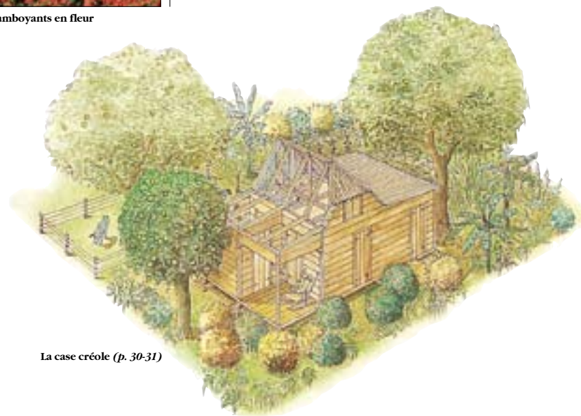
La case créole (p. 30-31)