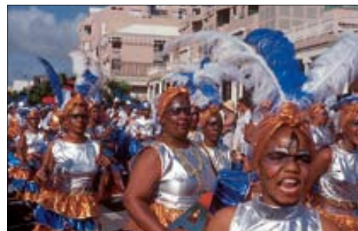
Le carnaval à Pointe-à-Pitre