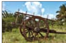
Cabrouet à Marie-Galante