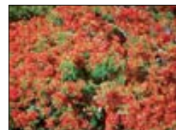
Flamboyants en fleur