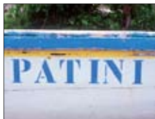
Barque à Ferry