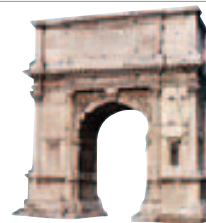
Arc de Titus