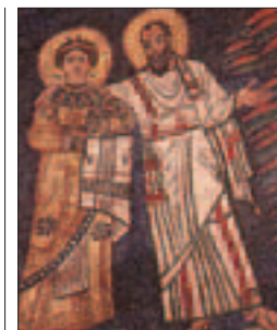
Mosaïque à Santa Prassede