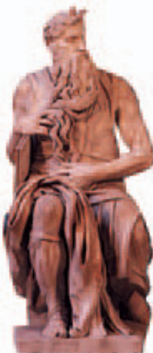
Le Moïse de Michel-Ange à San Pietro in Vincoli