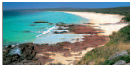
Sur la côte sud de la Nouvelle-Galles du Sud au Ben Boyd National Park

KINGS CROSS, DARLINGHURST ET PADDINGTON 116