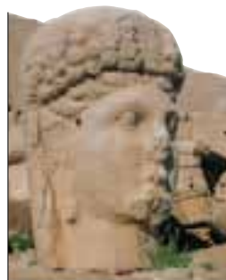
Tête en pierre sur le mont Nemrut (Nemrut Dağı) en Commagène