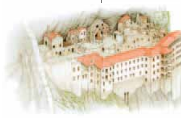
Le monastère de Sumela (p. 272)