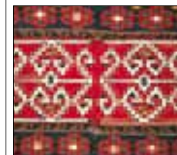
Tissages turcs à motifs géométriques