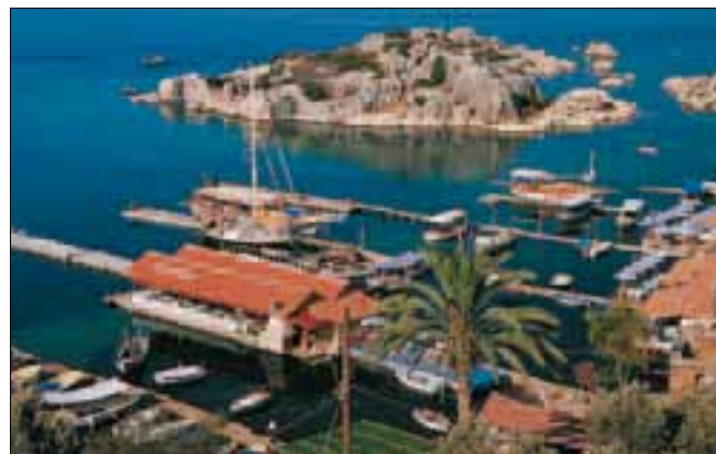
Le village d'Üçağız sur la côte méditerranéenne

Dépôt légal : janvier 2010 ISBN : 978-2-01-244592-5 ISSN : 1246-8134 Collection 32 – Édition 01 N° DE CODIFICATION : 24-4592-2