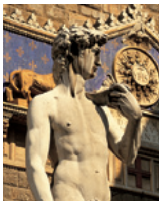
Gauche David de Michel-Ange Droite Le hameau de Montefioralle