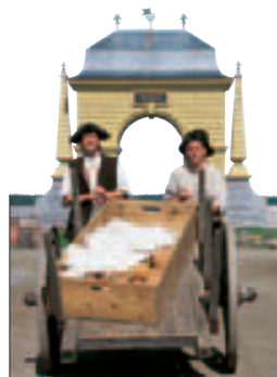
Reconstitution de la forteresse de Louisbourg, Nouvelle-Écosse

NOUVEAU-BRUNSWICK, ÎLE-DU-PRINCE-ÉDOUARD ET NOUVELLE-ÉCOSSE 74