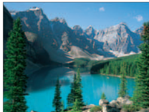
Le lac Moraine dans le parc national de Banff, Rocheuses