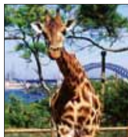
Girafe du Taronga Zoo de Sydney