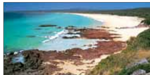
Sur la côte sud de la Nouvelle-Galles du Sud au Ben Boyd National Park

KINGS CROSS, DARLINGHURST ET PADDINGTON 116