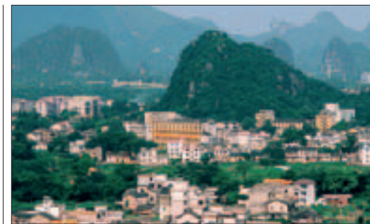
Spectaculaires collines karstiques dans Guilin, Guangxi