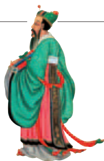
Confucius (551-479 av. J.-C.)

Achévé d'imprimer en février 2014 Dépôt légal : février 2014 ISBN : 978-2-01-245431-6 ISSN : 1246-8134 Collection 32 - Édition 01 N° de codification : 24-5431-2