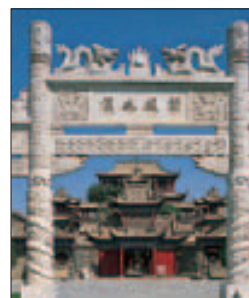
Pailou (portique décoratif), Gao miao à Zhongwei, Ningxia