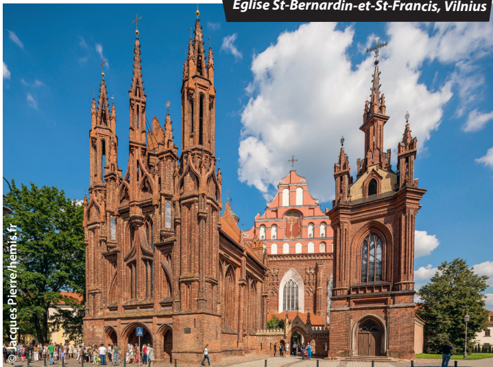
Église St-Bernardin-et-St-Francis, Vilnius

☎ 112 : c'est le numéro d'urgence commun à la France et à tous les pays de l'UE, à composer en cas d'accident, agression ou détresse. Il permet de se faire localiser et aider en français, tout en améliorant les délais d'intervention des services de secours.