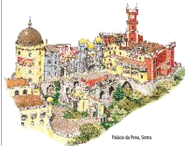
Palácio da Pena, Sintra

Carte des transports et plan détachable de la ville en couverture arrière intérieure