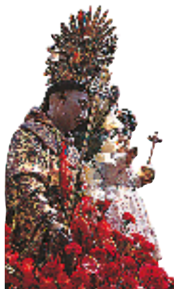
Statue de saint Antoine parée pour la procession organisée en son honneur, le jour de sa fête