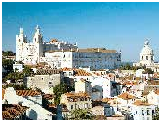
Vue de São Vicente de Fora et du dôme de Santa Engrácia