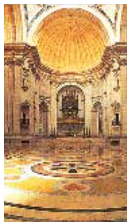
Pavement en marbre polychrome sous la coupole de Santa Engrácia