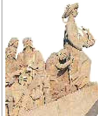
Le monument des Découvertes