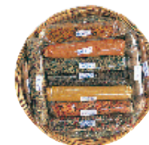
Panier d'herbes et d'épices, Héraklion, Crète