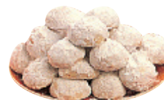
Sablés aux amandes savourés à Noël et à Pâques