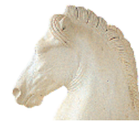
Tête de cheval romaine, Musée archéologique