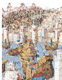
Arrivée du prince ottoman Djem à Rhodes (XV e s.)