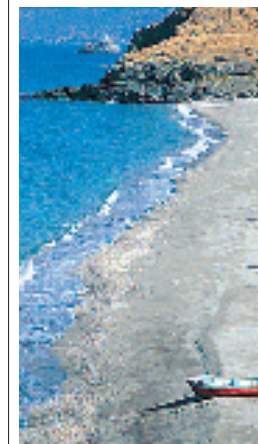
Plage de Kámpos à Icarie (nord-est de la mer Égée)