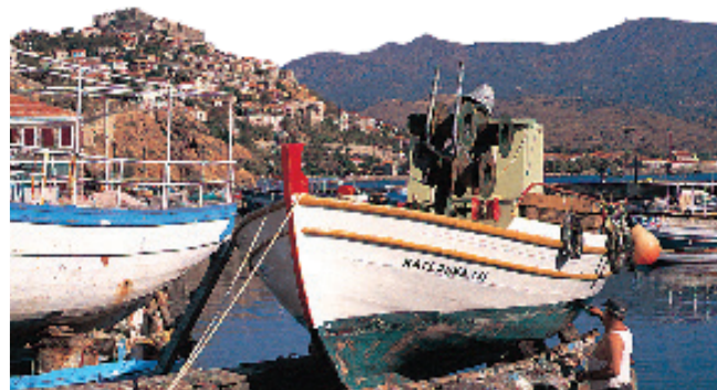
Port de Molyvos, Lesbos