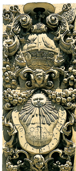
Cadran solaire baroque d'un palais de Palma