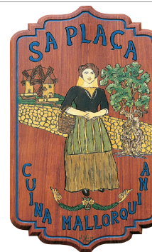
Enseigne de restaurant de spécialités majorquines