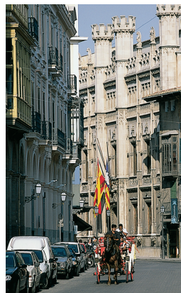
Promenade en calèche dans le vieux Palma