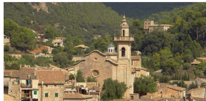
Valldemossa, île de Majorque