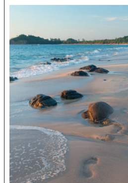
Plage Ngapali, sur le golfe du Bengale, Ouest de la Birmanie