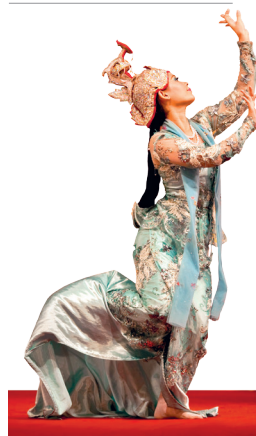
Danse classique birmane au palais Karaweik de Yangon