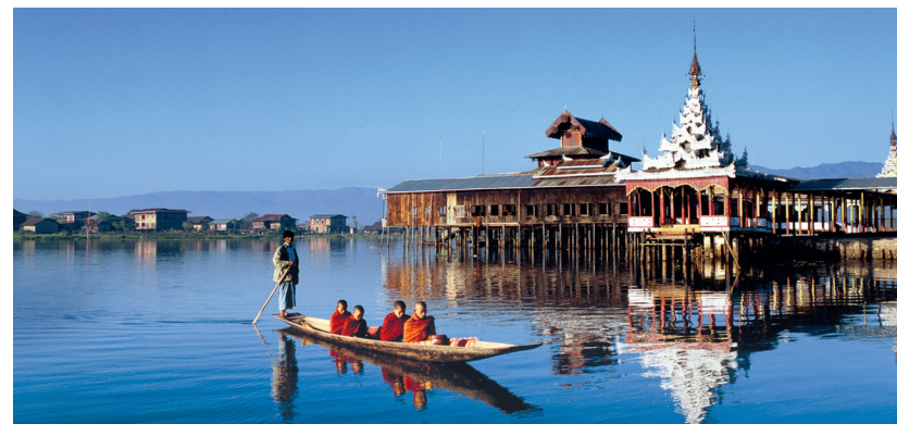
Moines passant en barque devant le monastère Nga Phe Kyaung sur le lac Inle, Est de la Birmanie