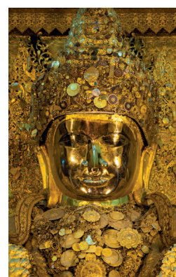
Bouddha Mahamuni de Mandalay, couvert d'or par les dévots