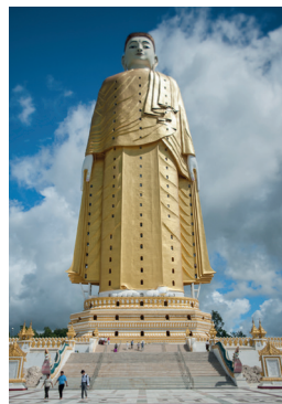
Bouddha colossal de Bodhi Tataung, Mandalay