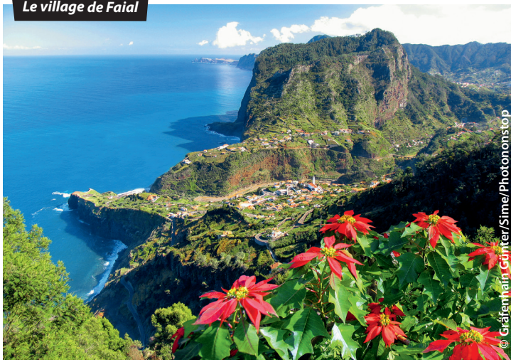
Le village de Faial

☎ 112 : c'est le numéro d'urgence commun à la France et à tous les pays de l'UE, à composer en cas d'accident, agression ou détresse. Il permet de se faire localiser et aider en français, tout en améliorant les délais d'intervention des services de secours.