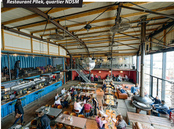
Restaurant Pplek, quartier NDSM

☎ 112 : c'est le numéro d'urgence commun à la France et à tous les pays de l'UE, à composer en cas d'accident, agression ou détresse. Il permet de se faire localiser et aider en français, tout en améliorant les délais d'intervention des services de secours.