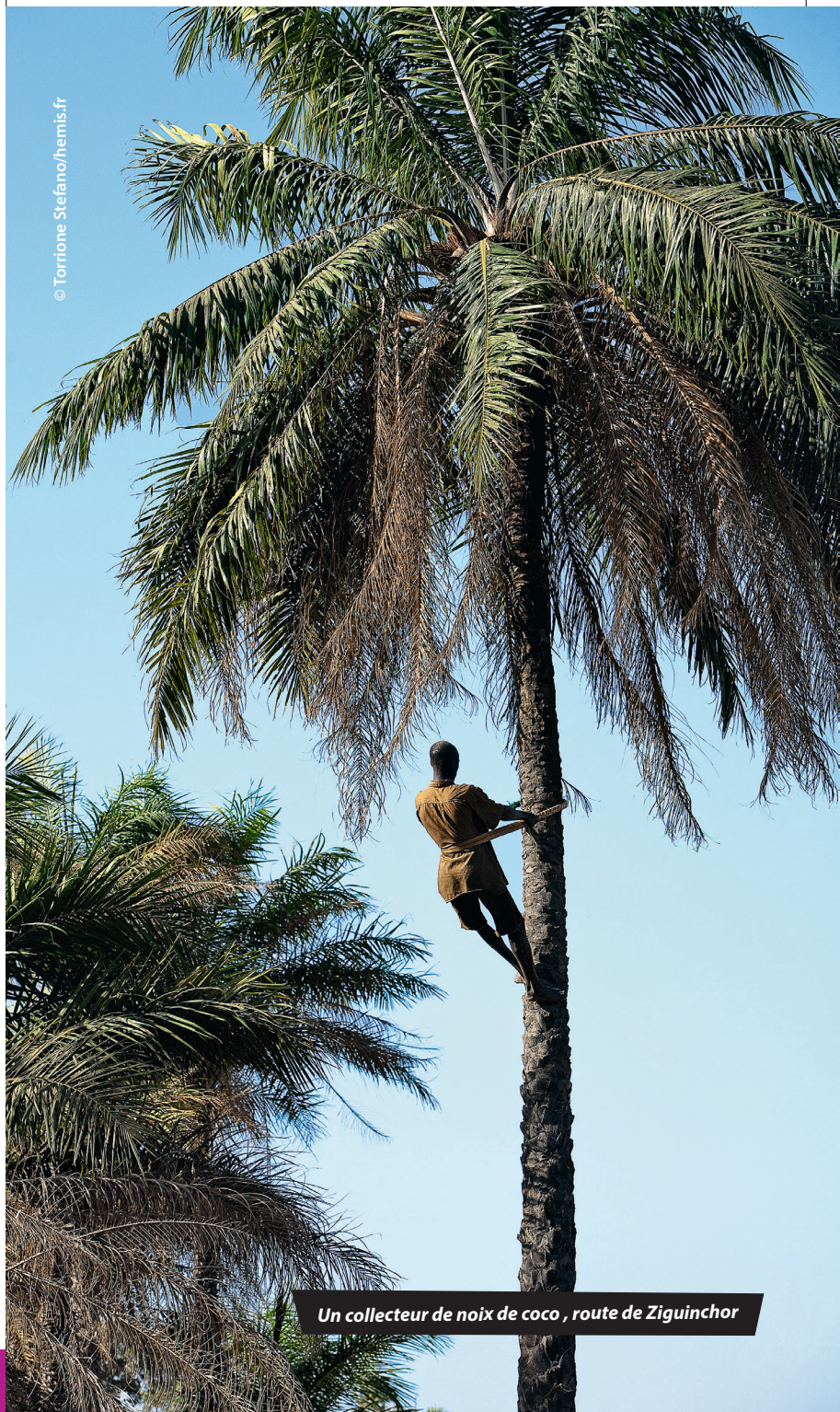
Un collecteur de noix de coco , route de Ziguinchor