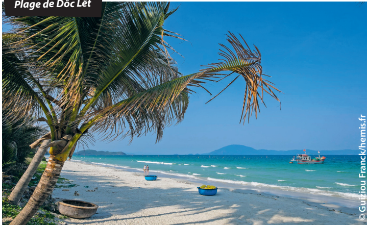
Plage de Dốc Lết

Sauf rares exceptions, le Routard bénéficie d'une parution annuelle à date fixe. Entre deux dates, des événements fortuits (formalités, taux de change, catastrophes naturelles, conditions d'accès aux sites, fermetures inopinées, etc.) peuvent modifier vos projets de voyage. Pour éviter les déconvenues, nous vous recommandons de consulter la rubrique « Guide » par pays de notre site routard.com et plus particulièrement les dernières Actus voyageurs .