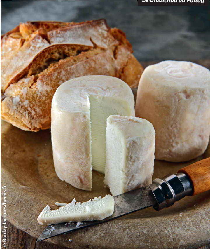
Le chabichou du Poitou

À l'hôtel, pensez à les demander au moment de la réservation ou, si vous n'avez pas réservé, à l'arrivée . Ils ne sont valables que pour les réservations en direct et ne sont pas cumulables avec d'autres offres promotionnelles (notamment sur Internet). Au restaurant, parlez-en au moment de la commande et surtout avant que l'addition ne soit établie. Poser votre Routard sur la table ne suffit pas : le personnel de salle n'est pas toujours au courant et une fois le ticket de caisse imprimé, il est souvent difficile de modifier le total. En cas de doute, montrez la notice relative à l'établissement dans le Routard de l'année et, bien sûr, ne manquez pas de nous faire part de toute difficulté rencontrée.