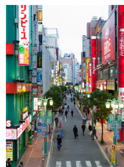
Boutiques dans une rue de Shinjuku, Tokyo.