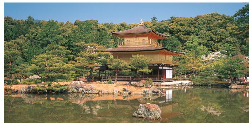
Le superbe Kinkaku-ji (temple du Pavillon d'or) resplendit sous le soleil, Kyoto