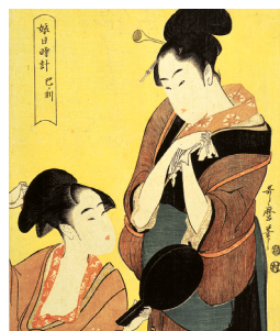
Ukiyo-e ou « image du monde flottant » Musée national du Japon