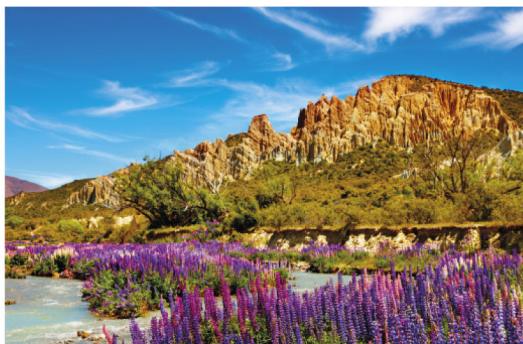
Pleine floraison dans la Clay Cliffs Scenic Reserve

Conformément à une jurisprudence constante (Toulouse 14, 01. 1887), les erreurs ou omissions involontaires qui auraient pu subsister dans ce guide, malgré nos soins et les contrôles de l'équipe de rédaction, ne sauraient engager la responsabilité de l'éditeur.