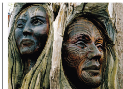
Sculptures maories sur bois figurant le visage d'un homme et d'une femme