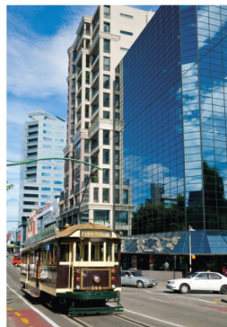
Tramway circulant sur Cashel Street, dans la ville de Christchurch