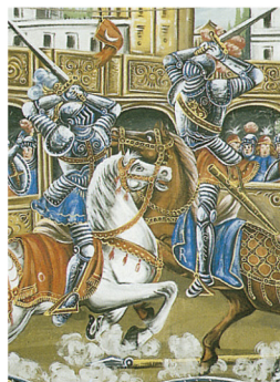
Décor de théâtre, Museo delle Marionette, Palerme (p. 50-51)