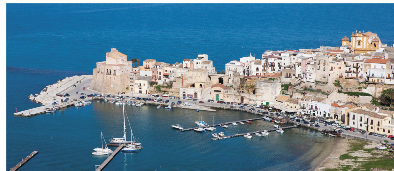
Castellammare del Golfo (p. 100), l'une des pittoresques localités de pêcheurs jalonnant la côte sicilienne