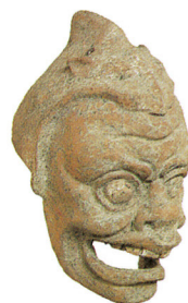
Masque de théâtre antique, Museo Archeologico Eoliano, Lipari (p. 194)