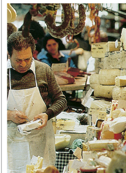
Étal de fromager sur le marché de Catane (p. 218-219)