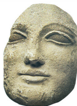
Visage de femme sculpté au ve siècle av. J.-C. (p. 34-35)